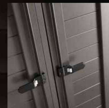
Diomedea doghe orizzontali horizontal slats