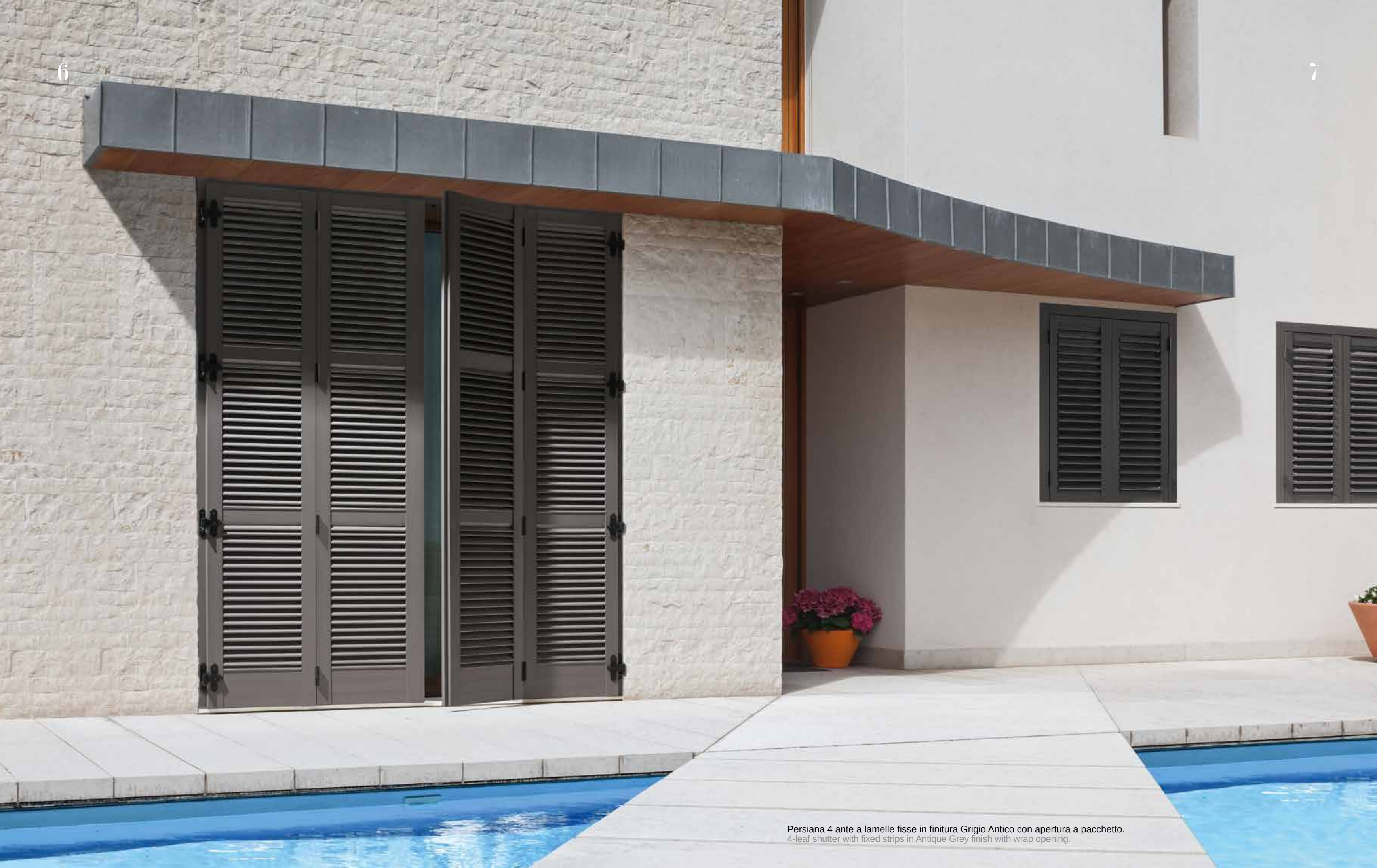
Persiana 4 ante a lamelle fisse in finitura Grigio Antico con apertura a pacchetto. 4-leaf shutter with fixed strips in Antique Grey finish with wrap opening.