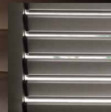
Diomedea lamelle orientabili a goccia Drop-shaped adjustable strips