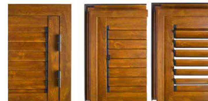
VISTA ESTERNA EXTERNAL VIEW

AN ELEGANT, DYNAMIC STRUCTURE Bestows light and ventilation Offers protection from prying eyes.